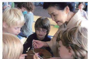
海外で組紐を指導する所さん。