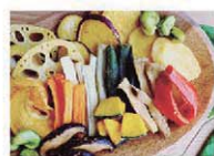
サクサク厚切りの野菜チップス。