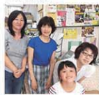
NPO法人 大垣おやこ劇場の 皆さん・実行委員

案内人 小物の売り子さん や当日通貨を両替 する銀行員など、い ろんなお仕事があ りますよ!