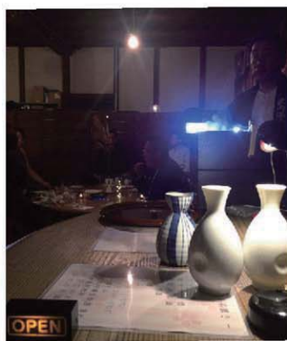
雰囲気のある古い酒蔵