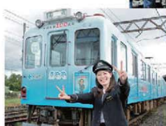
市制100周年を記念した車両も運行している。