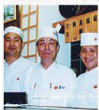
寿し吉の職人の皆さん

カウンターで寿司を握る姿は格好いいですね。あなたも職人気分握ってみませんか。にぎり寿司だけでなく、細巻き・太巻きまで直々にプロの技を教わることが出来ます。また、寿司職人さんたちが握った寿司との楽しい食べ比べをするほか、寿司の豆知識も学びます。