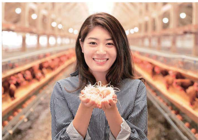
鶏舎では、毎日、たくさんの新鮮なたまごが産まれています。