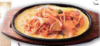
昔懐かしい鉄板イタリアン。