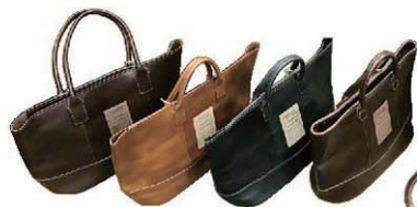
革製バッグ。ヴィンテージの生地使用商品もあり。