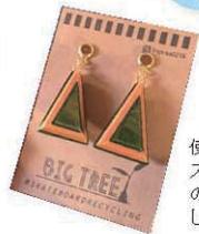
使わなくなったスケートボードの板をリサイクルしたピアス。