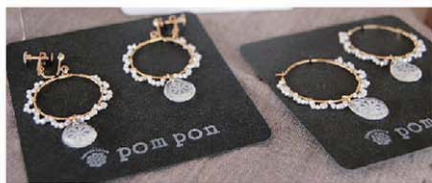
天然石、パールなどを使ったアクセサリ。