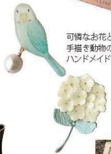
可憐なお花と手描き動物のハンドメイドアクセサリ。