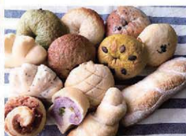
国産小麦を使った天然酵母パン・ベグル、焼き菓子など。