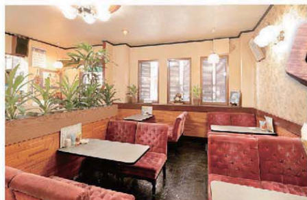
昭和レトロ感あふれる、ゆったりとした ビロード張りのソファ。