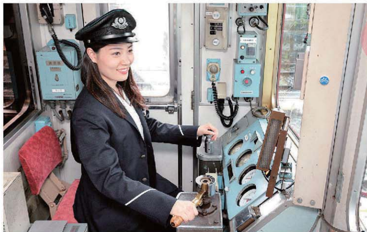
本物の車両を使用しての運転室見学。憧れの運転席に座ってみよう。