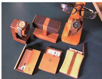
種類の違う木を組み合わせた文具系の木工小物