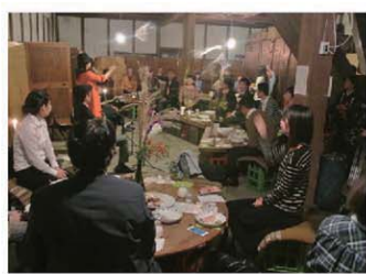
ライブハウスとなった酒蔵で、おいしいお酒を飲みながら素敵なひとときを!