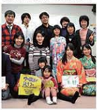
ヒポファミリークラブの皆さん

ところ 《集合場所》 大垣市多目的交流イベントハウス 1階談話コーナー(大垣市郭町2-28) 定員 8組 対象 親子(子ども:3歳~中学生)