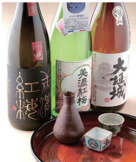
武内酒造の地酒「大垣城」や「美濃紅梅」を味わおう。

老舗の酒蔵で堪能するこだわりの地酒と音楽。水の都・大垣では、酒造りが古くから盛んに行われています。延享元年(1744年)創業の武内酒造で、何種類もの地酒の魅力を満喫してみませんか。酒蔵で日本酒の製造工程や味わい方などを学んだ後は、おいしい肴とともに盃を傾けるお待ちかねの時間。生演奏と共に大人の夕べをお楽しみください。