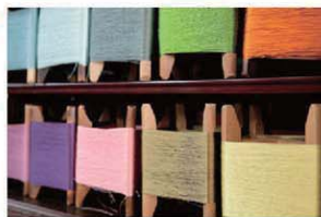
美しい草木染めの組糸。