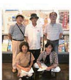
NPO法人水都まちづくりチーム41の皆さん

18世紀の城郭図と100年前の大垣市の古地図を片手に探偵ゲームによるまち歩きを楽しみましょう。フリーソフト「大垣ちずぶらり」「Board大垣ちずぶらり」を利用します。課題を解決すれば、まちなかのお店などでお菓子や飲み物を楽しむことができます。