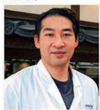
大垣菓子業同協会 青年部

江戸時代、美濃の国で最も栄えた城下町大垣は、岐阜県内でも有数の和菓子処です。この地に古くから暖簾を構える老舗和菓子屋の若旦那から、和菓子づくりを学んでみませんか。今回は旬の素材を使った秋の生菓子を作ります。できたての和菓子を味わってみましょう。