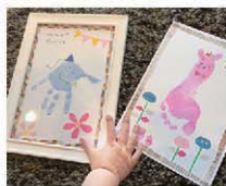
親子で楽しむ手形・足形アート。