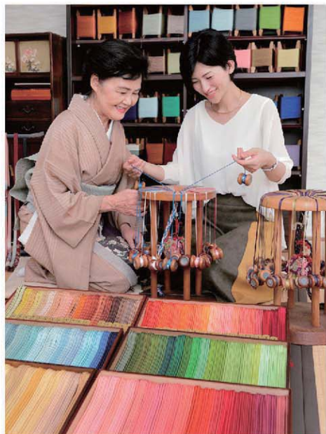
所さんが大垣に工房を開いたのは、良質な水と近郊で採取できる種類豊富な植物にあるという。 組紐ストラップとプレスレット。